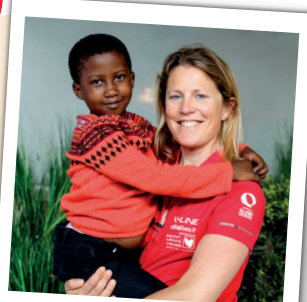
Organiser l'arrivée des enfants en France