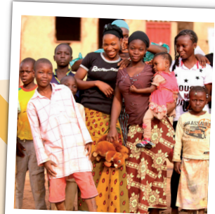
La convalescence et le retour guéri