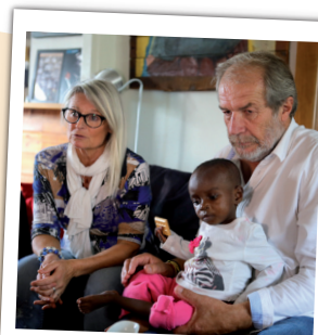
Séjour dans les familles d'accueil