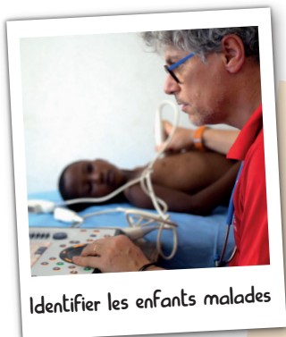
Identifier les enfants malades