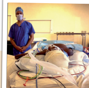
La phase chirurgicale